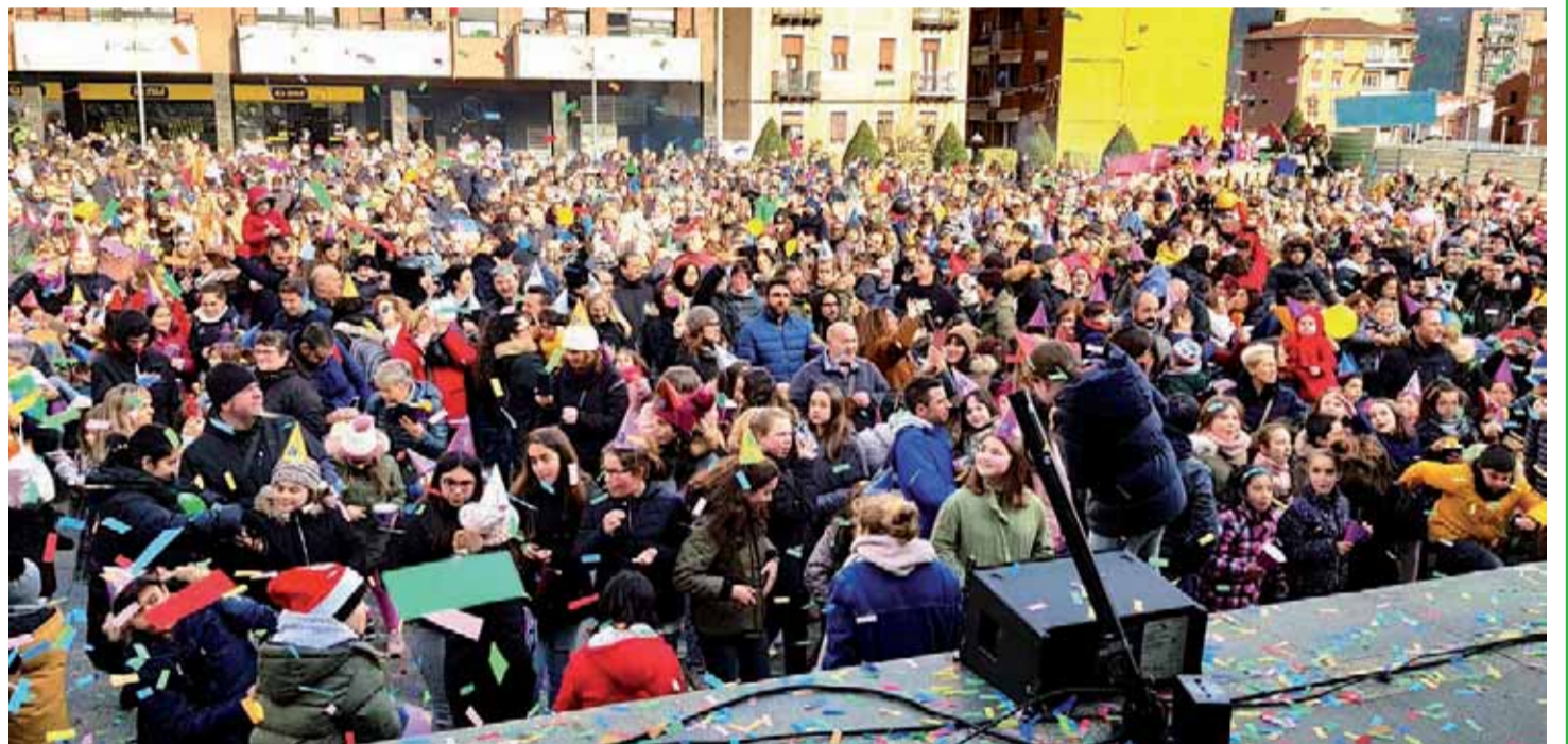
Exitazo de las campanadas infantiles con gominolas