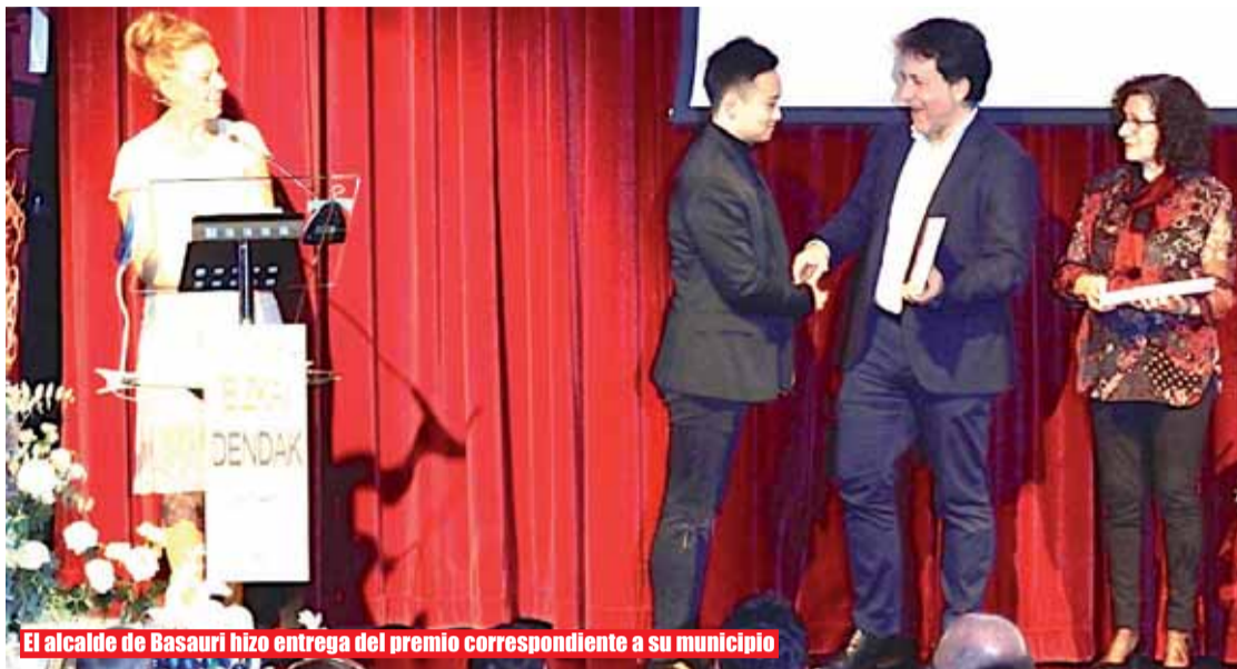
El alcalde de Basauri hizo entrega del premio correspondiente a su municipio